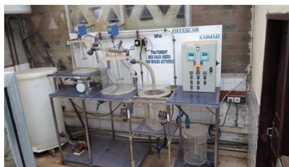
Unité de traitement des eaux usées par le système des boues activées